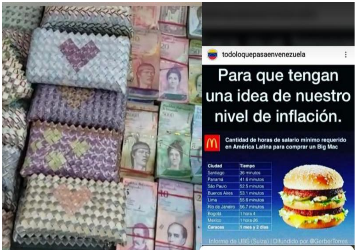
Monederos y carteras elaboradas con billetes de Bolívares desvalorados y vendidos baratos en las calles de Cúcuta, Colombia, por Venezolanos